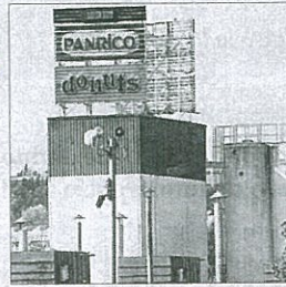
Planta en Santa Perpètua

La Generalitat se reunió ayer con la dirección y el comité de empresa de Panrico en Santa Perpètua de Mogoda y les reclamó que den "signos inequívocos" de su voluntad para llegar a un acuerdo, desconvocar la huelga y reactivar la fábrica a través de un expediente de regulación temporal de empleo. / EP