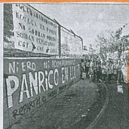
Protesta de Panrico

■ El comité de empresa de Panrico en Santa Perpètua de Mogoda rechazó someter a referéndum la nueva propuesta mediadora de la Generalitat y el sindicato CC.OO., que ofrecía reducir el número de despidos en la planta hasta los 66, según un comunicado d'Empresa i Ocupació. / Redacción